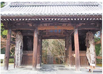
急坂を上った先にたたずむ根香寺の山門。本堂へは山門から石段をいったん下り、再び石段を上ります