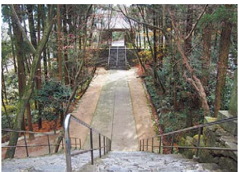
境内では階段を上り下りするので、歩きやすい靴と両手の空リュックなどが便利でしょう