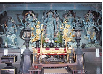
不動明王は1286年に作られ、他の4体は1683年に高松藩主松平頼重公の命で造られたことが、平成に行われた解体修復工事で明らかになりました